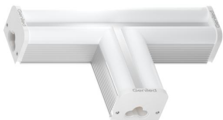
Рисунок 1 – Внешний вид светильника Geniled Лайнер-Т 8W 5000К.

Светодиодный Т-образный светильник Geniled Лайнер-Т 8W 5000К применяется для создания равномерного освещения для внутренних помещений, таких как: торговые площади, офисные и административные помещения. Благодаря особенностям конструкции, а так же различным исполнениям светильников серии Лайнер, можно создавать непрерывные светящиеся линии различных конфигураций, предоставляя больше возможностей для светового дизайна.